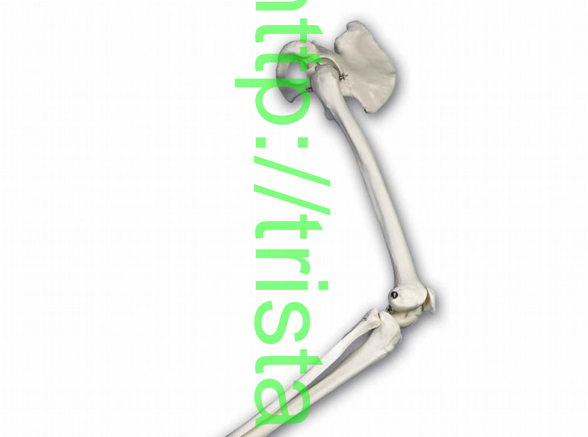
Schéma 1 : Anatomie de la jambe